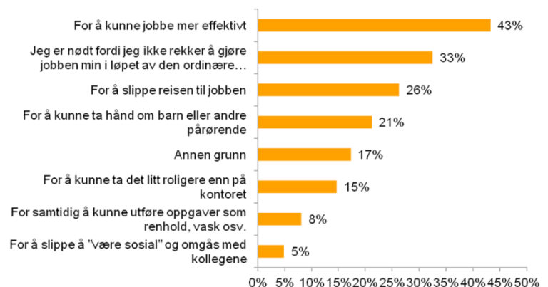
Hvorfor velger du som oftest å jobbe hjemmefra?

Manpower-undersøkelsen viser at hjemmejobberne lar seg forstyrre av en rekke ting når de ikke jobber fra kontoret. Hele 34 prosent oppgir at renhold og vask i huset gjør dem mindre effektive. Tilsvarende andel blir forstyrret av familiemedlemmer som krever oppmerksomhet, og 32 prosent har problemer med å holde seg borte fra TV-titting og nettsurfing.